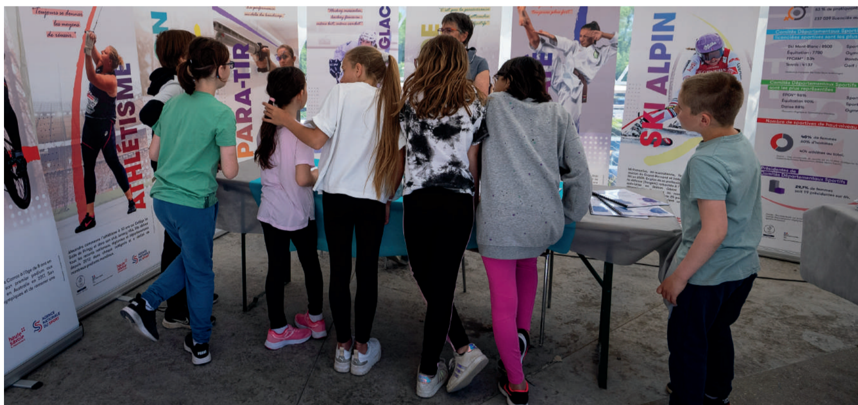
Le Village des Sports accueille plus de 350 élèves chaque année au printemps

Il prépare les dirigeants bénévoles aux tâches et aux mutations du monde associatif.