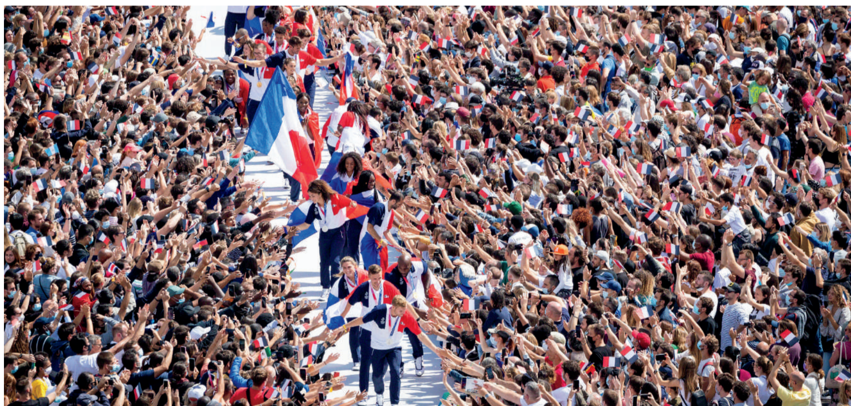
Célébration et héritage, marqueurs du projet « La Haute-Savoie se prend aux Jeux »

Ce dossier vise à rappeler l'engagement du Département, du mouvement sportif haut-savoyard et leur implication dans la réussite de Paris 2024 sur le territoire, depuis plusieurs années.