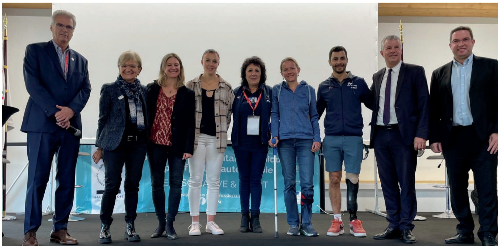
Le Conseil Départemental est aux côtés des sportifs haut-savoyards

Il facilite l'accès à la culture, encourage la pratique sportive, s'implique dans des actions favorisant une citoyenneté active et responsable.