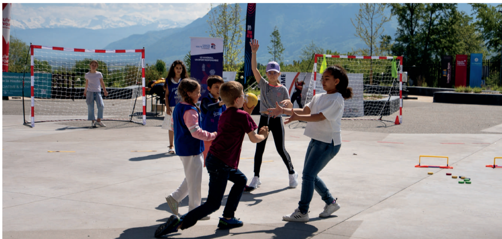
Les Jeux doivent constituer un tremplin pour favoriser la pratique sportive en club

La Haute-Savoie accueillera les Relais de la Flamme Olympique et Paralympique et les célébrations du centenaire de Chamonix 1924 constitueront une vitrine incroyable le 23 juin prochain.