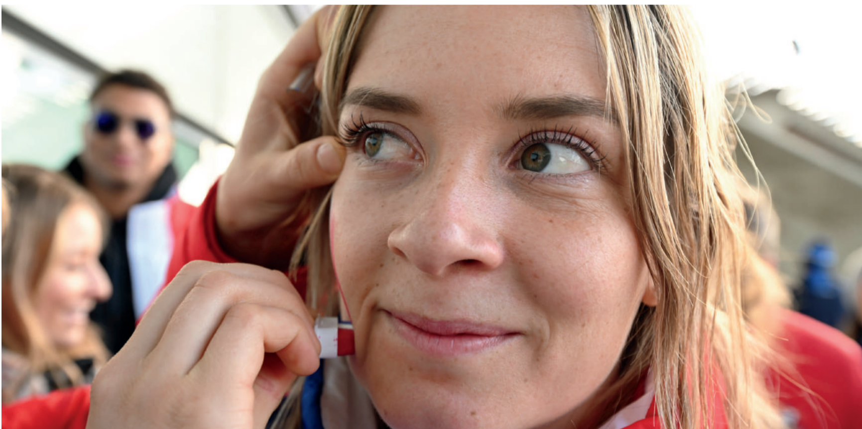
Assister aux épreuves et participer à la grande fête des Jeux, le rêve d'une vie

S'impliquer dans cette action favorise le développement de la pratique, alors que la promotion de l'activité physique et sportive a été promue « Grande Cause nationale » pour 2024.