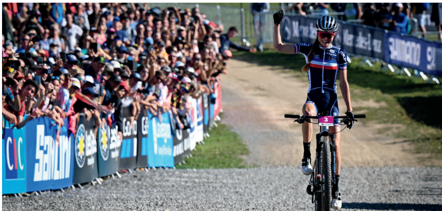
Les Gets ont accueilli les Championnats du Monde Mountain Bike UCI à l'été 2022