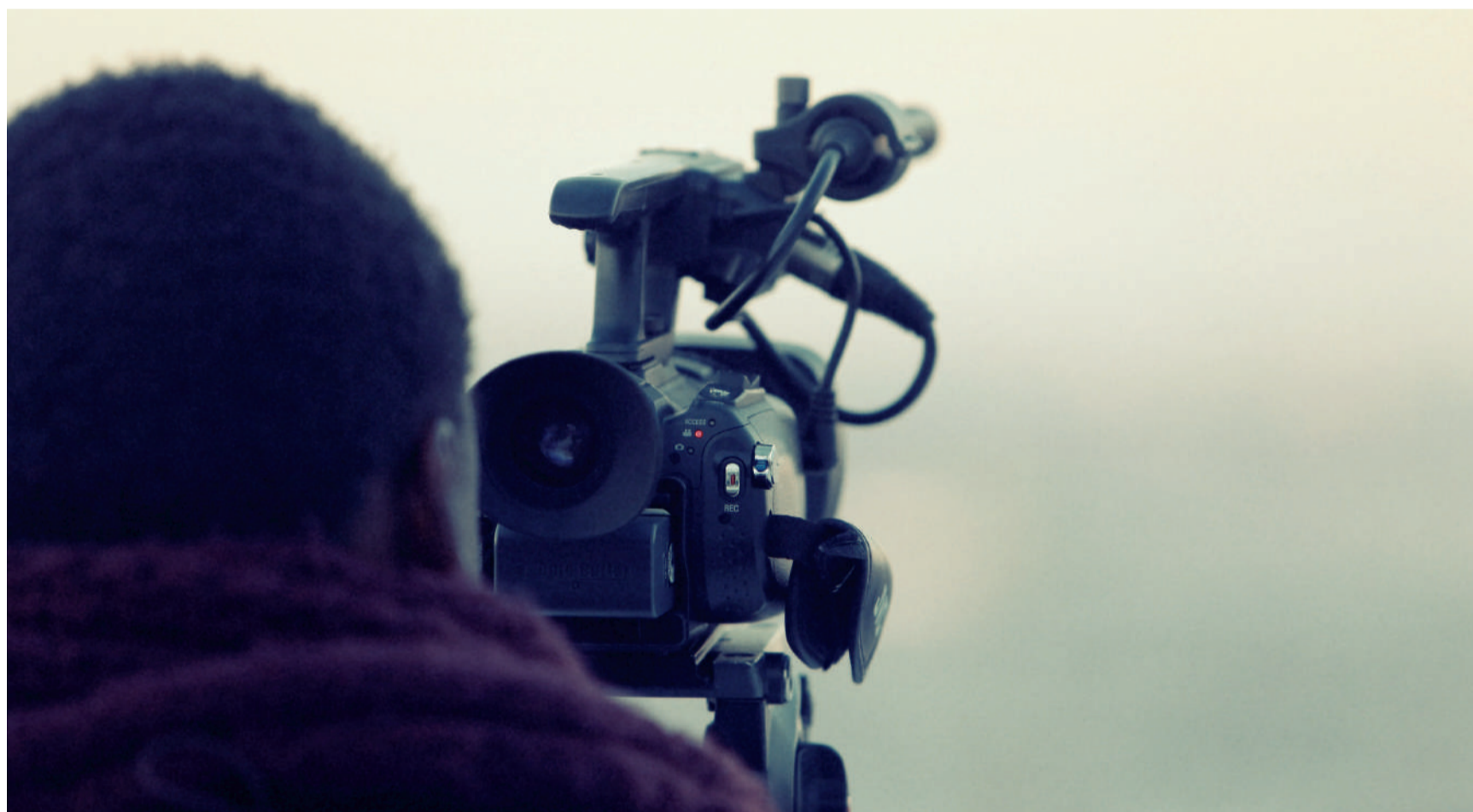
Un projet de cette envergure bénéficiera d'une couverture média de grande ampleur

La volonté est de construire des partenariats avec les principaux médias du département pour témoigner du dynamisme du territoire .